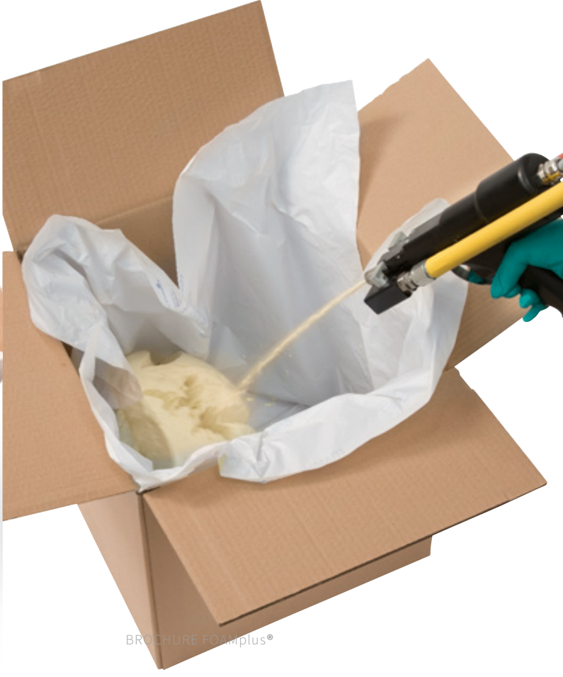
FOAMplus® Direct Injection