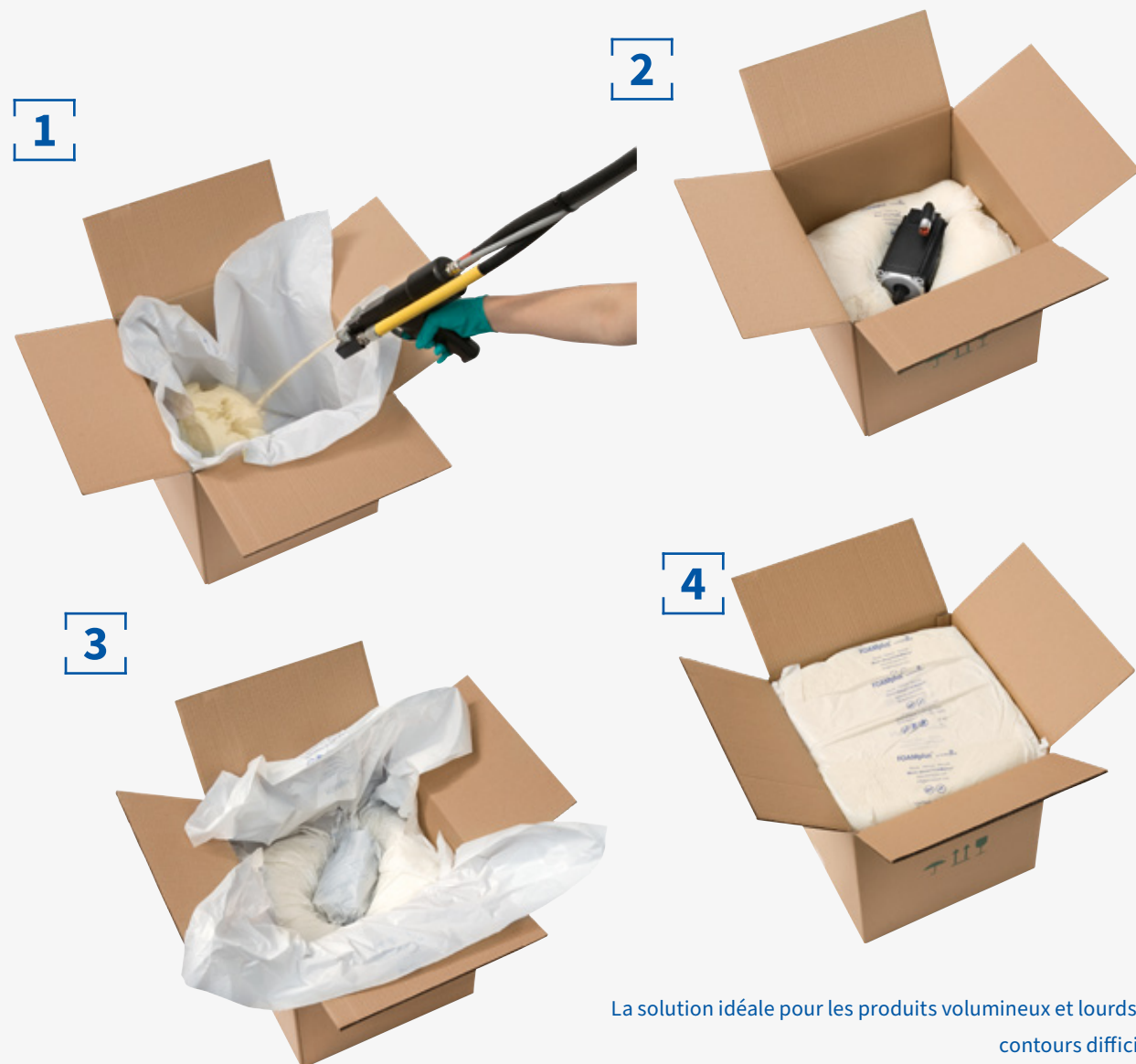
La solution idéale pour les produits volumineux et lourds aux contours difficiles : FOAMplus® Hand Packer² pour l'injection directe