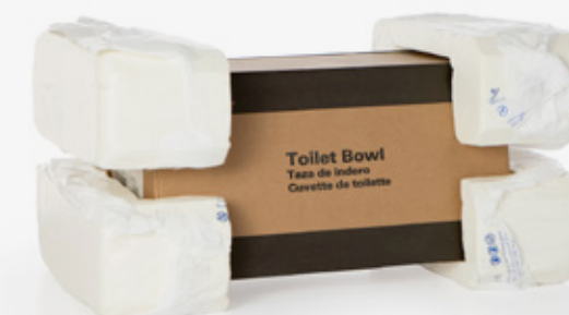
La solution rapide pour les emballages de protection moulés : FOAMplus® Premoulage