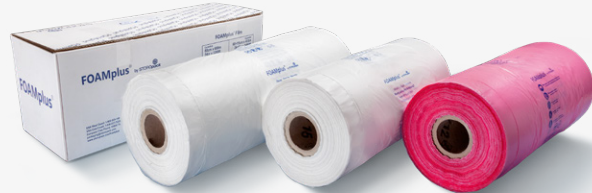
L'option sûre et durable : les films FOAMplus®