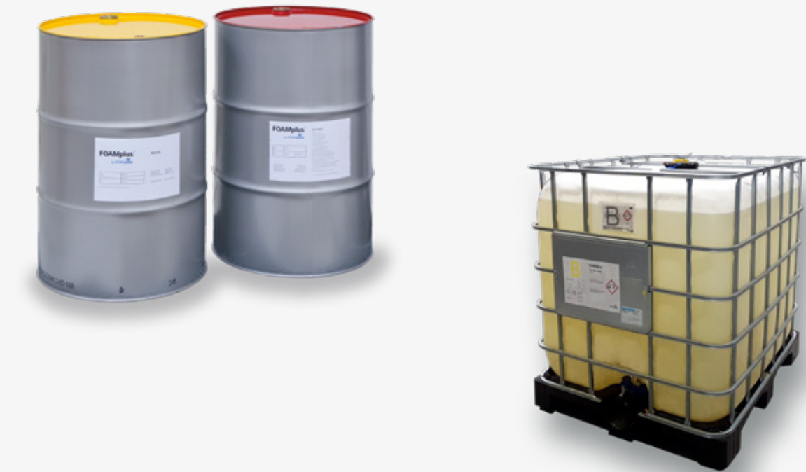
La solution idéale pour toute demande : Fûts métalliques et conteneurs FOAMplus®