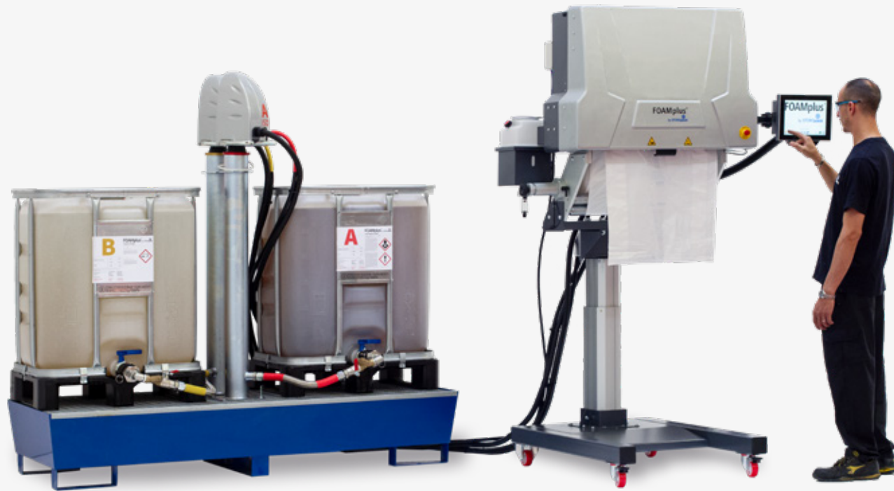
Emballage efficace pour les applications à haut débit : Système de dosage à distance FOAMplus® avec FOAMplus® Bag Packer²