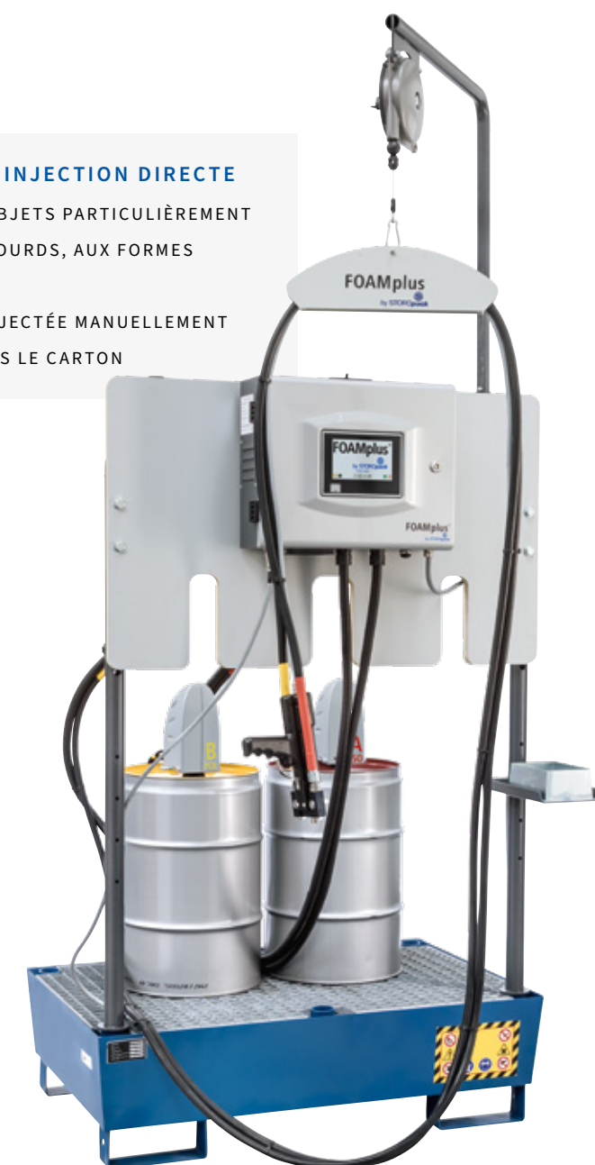
FOAMplus® Hand Packer² Stand Version